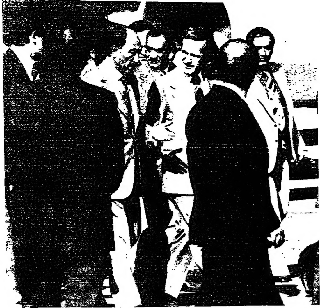
الرئيسان يحضرا دمشق في مطار دمشق